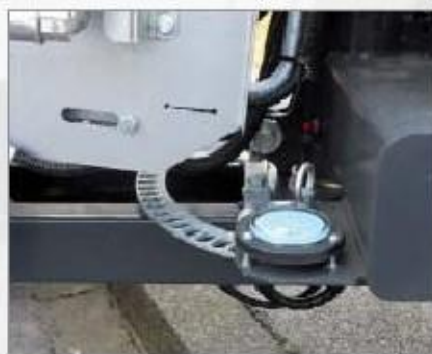
Vícenásobně nastavitelný otáčecí mechanismus