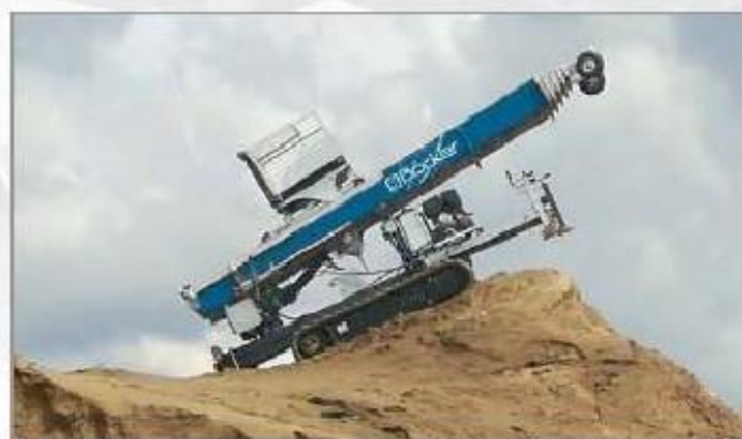
Na pání: pásový podvozek