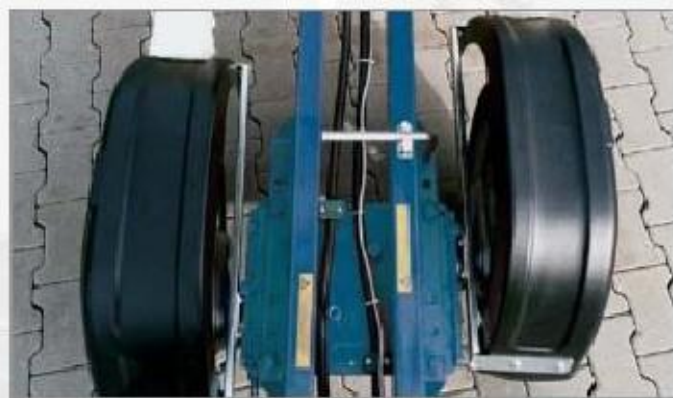
Na pání: zasouvací náprava 0,89 m