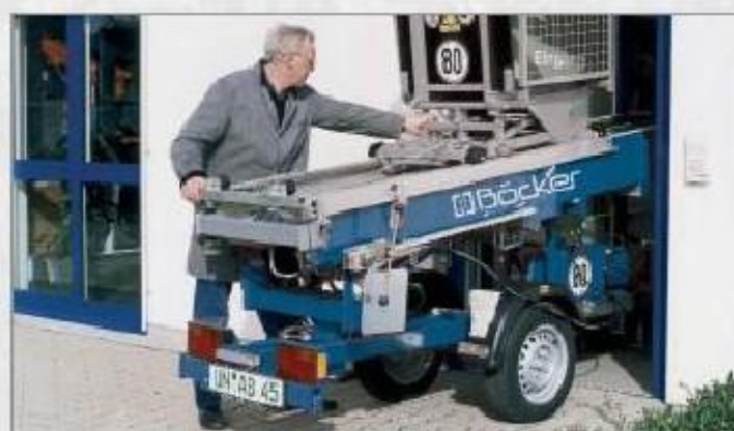
Vejde se i do standardních dveří