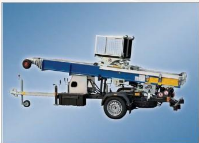
Stavební výtah Junior může být transportován za osobními auty