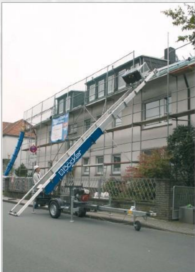
HD 24 K v nasazení s integrovaným lomeným dílem

Kompaktní zikmý stavební výtah Junior je ideální pro použití ve stísněných prostorách. Ve spojení s vysokou užitečnou hmotností až 250 kg a integrovaným nebo mechanicky montovaným lomeným dílem je zikmý stavební výtah Böcker Junior ideální jako stavební výtah pro rychlý a efektivní transport materiálu vzduchem, kde je málo místa. Ne nadarmo patří Böcker - stavební výtah Junior k nejvíce prodávaným stavebním výtahům ve světě.