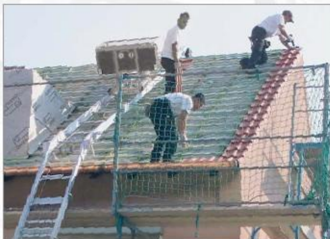
Nasazení s mechanickým lomeným dílem (na páni)