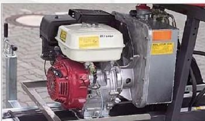
Na pání: benzínový motor