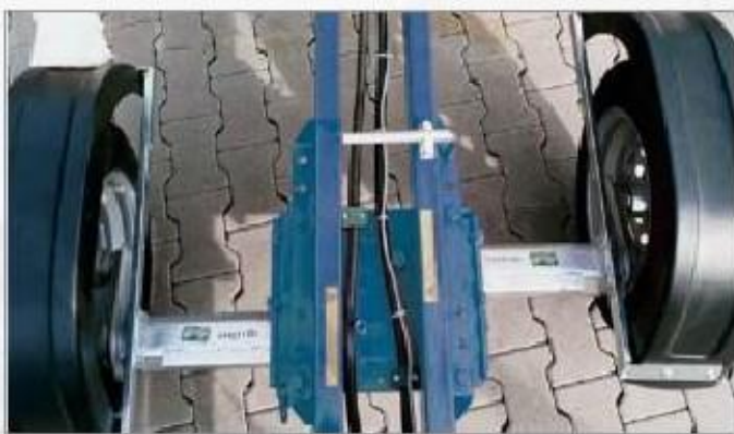
Standardní náprava (pevná) 1,3 m