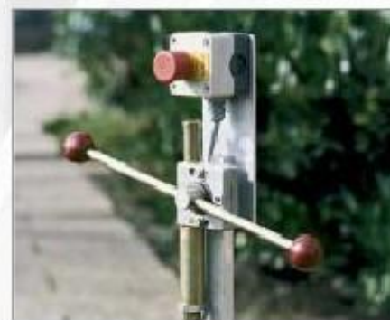
Na páhání: mechanické dálkové ovládání