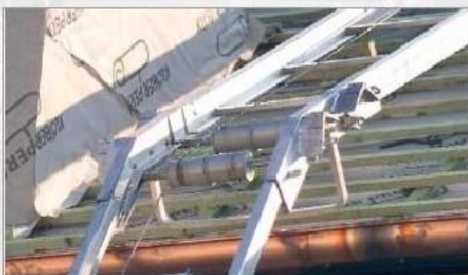
Na pání: mechanicky lomený díl