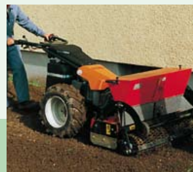
Rotační brány/secí stroj