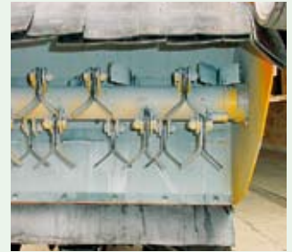
Robustní jednotka mulčovače

Výškově a do strany nastavitelná řídkta umožňují za každé situace nalézt optimální polohu pro vedení stroje