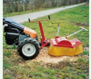
Fréza na pařezy