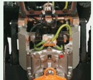
Přípojka pro přístroje a vázací oko