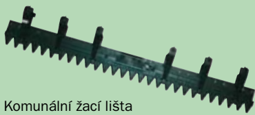
Komunální žací lišta