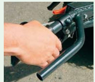
Na přání oblouk pro ochranu rukou

Jednotka mulčovače je dimenzována pro tvrdé profesionální použití. Tak například „Y nože“ jsou vyrobené z materiálu o tloušťce 6 mm. Také hřídel a uložení mulčovače jsou pro dlouhou životnost velmi robustně dimenzovány. Nastavování výšky řezu se provádí pomocí velkých předních kol.