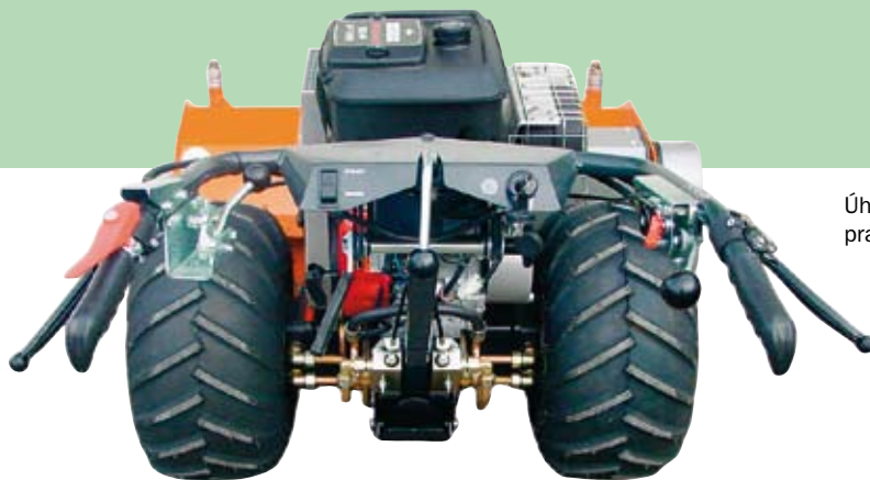
Úhledné a přehledné pracoviště