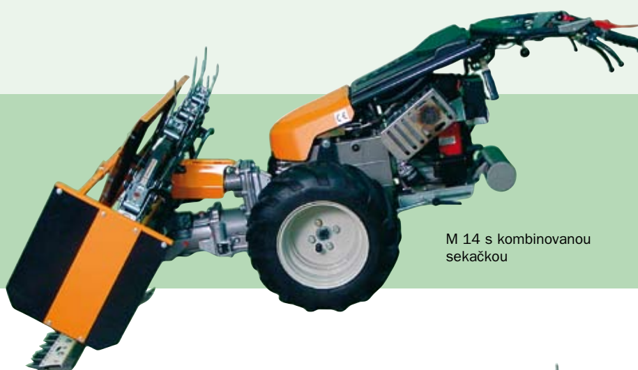
M 14 s kombinovanou sekačkou

M 14 s dvouportálovou protiběžnou žací lištou pro použití v horském zemědělství, rybníkářství a údržbu svahů