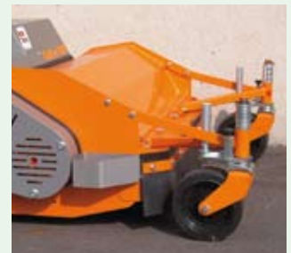
Vysoké vodící kolo a nájezdová ochrana

Cutter 100 je vybaven jemně dávkovatelnými ventily řízení, které zaručují perfektní ovládání stroje ve všech podmínkách.