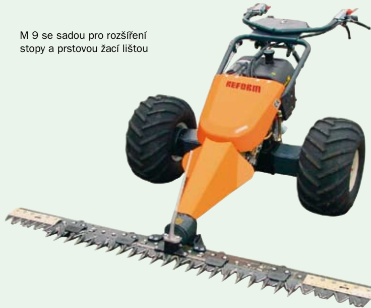
M 9 se sadou pro rozšíření stopy a prstovou žací lištou