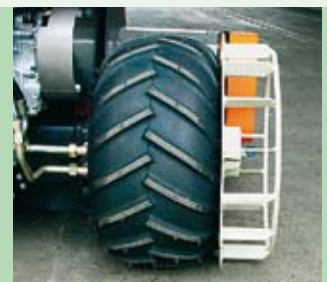
Mřížová kola dodávaná na přání