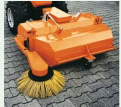
Zametací stroj s postranními kartáči