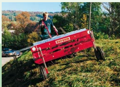
Pásový obraceč/ shrnovač