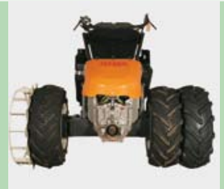
Dvojitá a mřížová kola