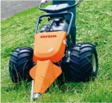
M 9 s komunální žací lištou a pohonem Rotoflex