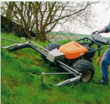
M 9 s dvouportálovou protiběžnou žací lištou