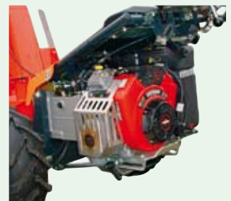
Motor a páka pro nastavování nápravy