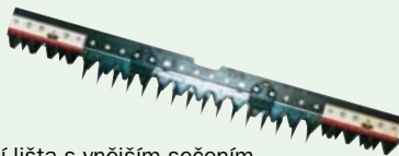
Prstová žací lišta s vnějším sečením