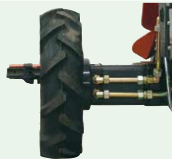
Sada pro rozšířenou stopu