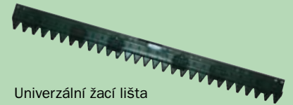
Univerzální žací lišta