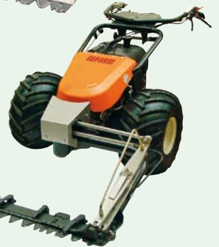
M 9 s portálovou protiběžnou žací lištou