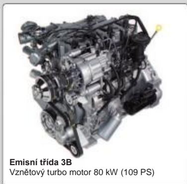
Emisní třída 3B Vznetový turbo motor 80 kW (109 PS)

Motor s výkonem 109 koní s technologií vstřikování COMMON - RAIL splňuje emisní třídu 3B. Elektronický pedál akcelérátoru s funkcí „Power take-off“, který vyhodnocuje a bere do úvahy všechny provozní podmínky, umožňuje nastavení otáček pro vývodový hřídel nebo vysokovýkonnou pracovní hydrauliku. Volitelně je k dispozici motor s výkonem 109 koní splňující emisní třídu EURO 6.